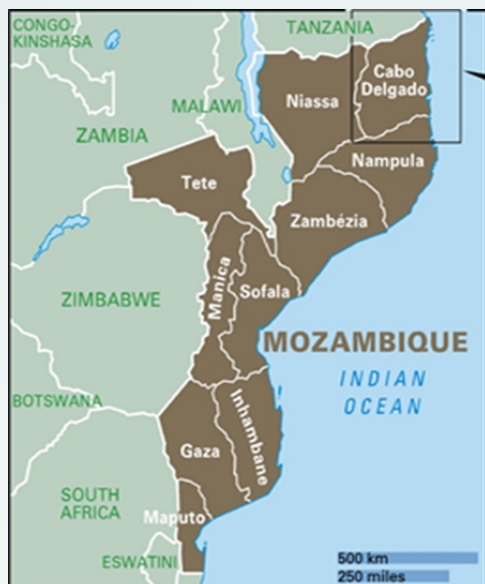
Figura 1 – mapa de Moçambique

Sob o ponto de vista geoestratégico a localização geográfica de Moçambique (com destaque para a província de Cabo Delgado) tem relevância no contexto internacional, uma vez que as suas águas jurisdicionais na zona do oceano Índico fazem interligação com o canal de Moçambique 35 .