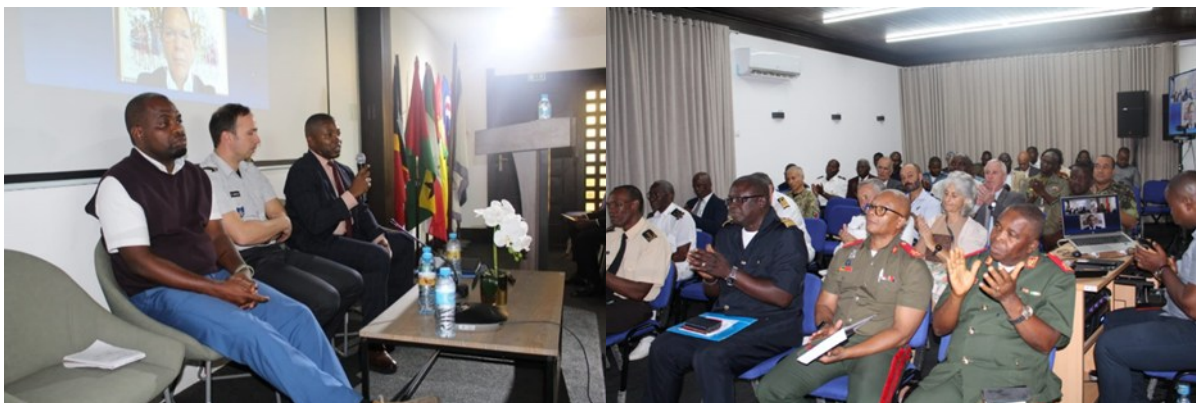
Foto 5 - Sessão de debate

Defesa Civil. Podendo, entre outros fins, ser usada para: (i) Monitoramento de eventos extremos; (ii) Combate a incêndios florestais; (iii) Resposta a desastres naturais; (iv) Apoio aos órgãos públicos; (v) Monitoramento de áreas de desmatamento; (vi) Monitoramento do garimpo ilegal; (vii) Movimentação de aeronaves; (viii) Sistemas de gerenciamento de pistas; (ix) Apoio as operações das FFAA; (x) Mapeamento de alvos; (xi) Simulação de uma área que vai se alagar por enchente de um rio; e (xii) Partilha de imagens.