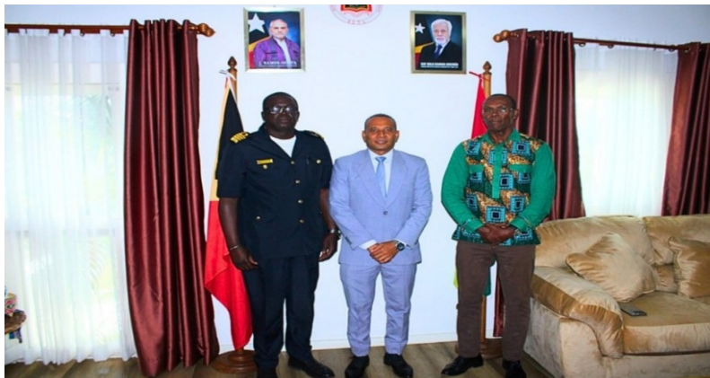
Foto 6 – Embaixador de Timor-Leste, no centro, novo Diretor e Diretor cessante do CAE/CPLP, a direita e a esquerda respetivamente

“Estratégia: Pesquisar, Estudar e Difundir!” www.caecplp.org