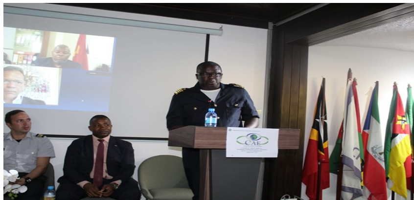
Foto 3 - Director do CAE/CPLP realizando a abertura do Seminário

O XXIX Seminário Internacional Político-Estratégico teve por objetivo ponderar a necessidade e exequibilidade da criação de um fórum de cooperação em geointeligência na CPLP. Para tanto, buscou-se (i) Analisar a importância da geointeligência no contexto actual das conflitualidades; (ii) Identificar contributos que potenciem a relevância estratégica da criação de um fórum de cooperação em geointeligência na Componente de Defesa da CPLP; e (iii) Identificar as oportunidades e desafios que se colocam aos EM no âmbito da Cooperação de Defesa em geointeligência na CPLP.